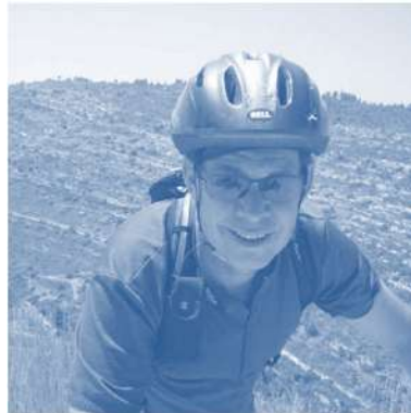
ישראל בשביל אופניים