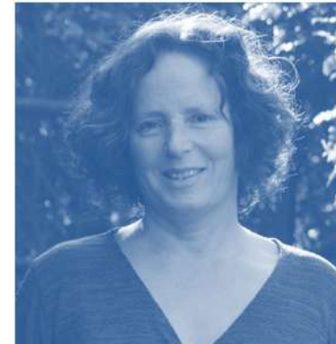
תחבורה היום ומחר