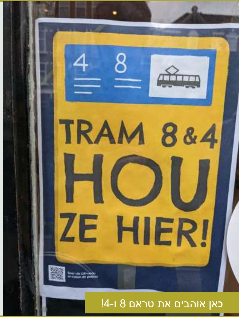
כאן אוהבים את טראם 8 ו-4!