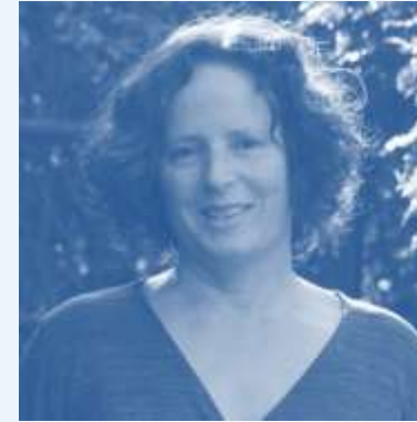
תחבורה היום ומחר