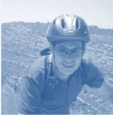
ישראל בשביל אופניים