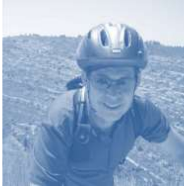
ישראל בשביל אופניים