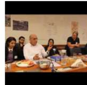
פורום רשויות #2 - 10.1.19 - פאנל בכירי רשויות בשרון