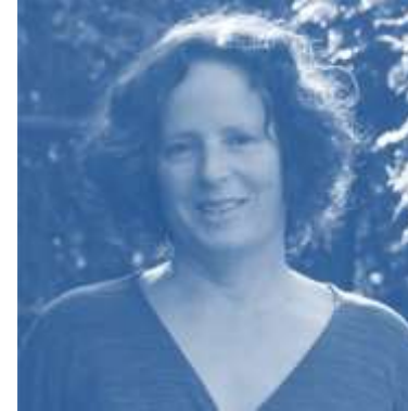
תחבורה היום ומחר