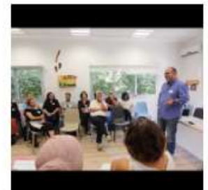
מפגש השקה למיזם - 31.5.18 - ברכת צביקה צרפתי, ראש העיר כפר סבא