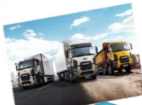
ניטור ואכיפת משקל משאיות ו זיהוי מסלולי נסיעה אופייניים