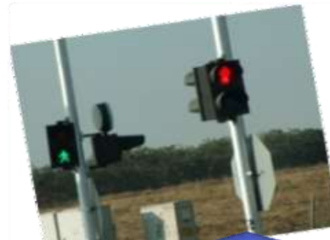
זיהוי הולכי רגל בצומת וזיהוי מסלולי הליכה