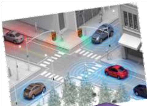
טכנולוגיות העדפה ברמזורים בתא שטח