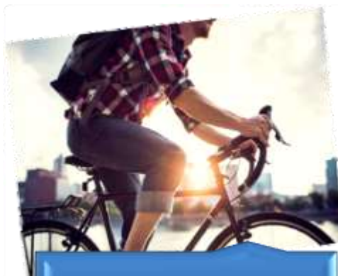
ניטור אירועים וניהול אוטוסטרדת אופניים